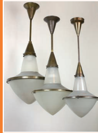
Zeiss-Ikon Stufenspiegelleuchten von Adolf Meyer, 1930