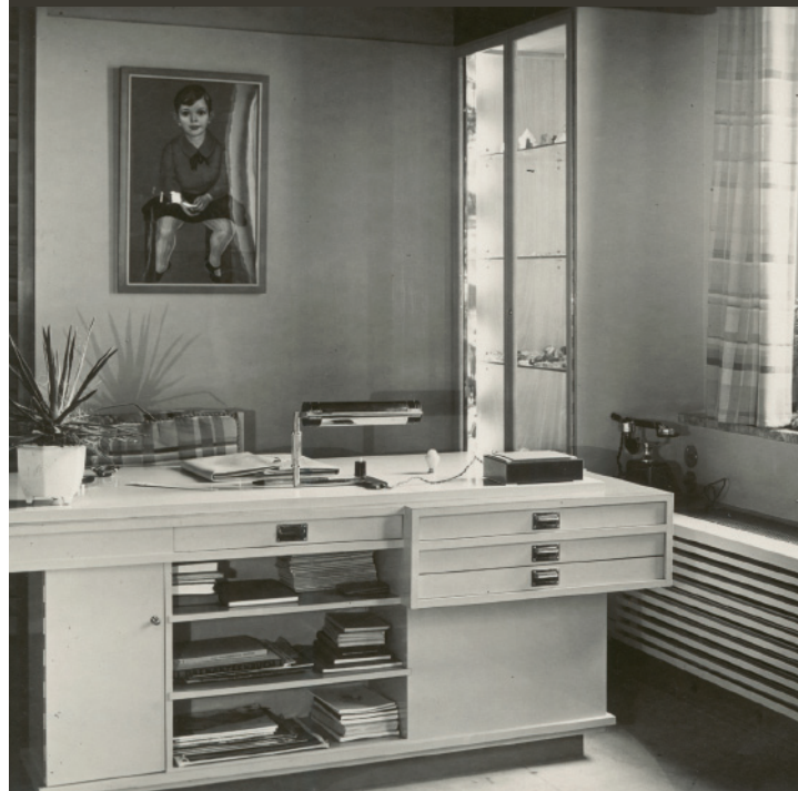
Wohnzimmer Aenne Biermann, Gera (1926).